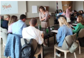
Formación sobre trabajo infantil con profesionales de los Centros de Trabajo Social realizada el 18 de octubre de 2023 en Belgrado (Serbia).

Porcentaje de respuesta bajo (11 %) en la encuesta electrónica de los beneficiarios de capacitación debido quizá al gran desfase entre cuando se impartió la capacitación y la distribución de la encuesta.