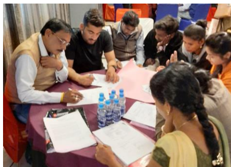
Debate grupal sobre formato de la encuesta sobre trabajo infantil del gobierno realizado en Chhattisgarh (India).