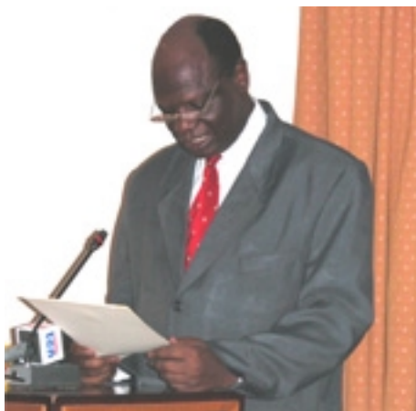
Dr. Juma Kapura, Ministro de Trabajo de Tanzania,

• En las empresas, las mujeres trabajadoras ganan en promedio el 49% de lo que ganan los hombres. La forma en que se distribuyen las prestaciones sociales hace que la desigualdad social del ingreso sea mayor que la desigualdad del ingreso.