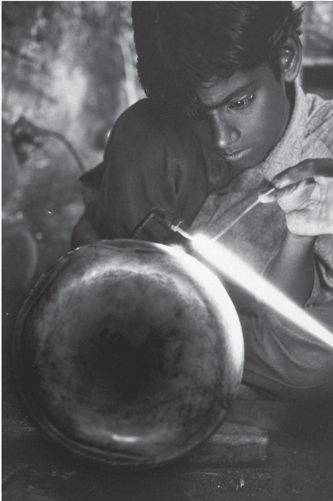
Niño soldador