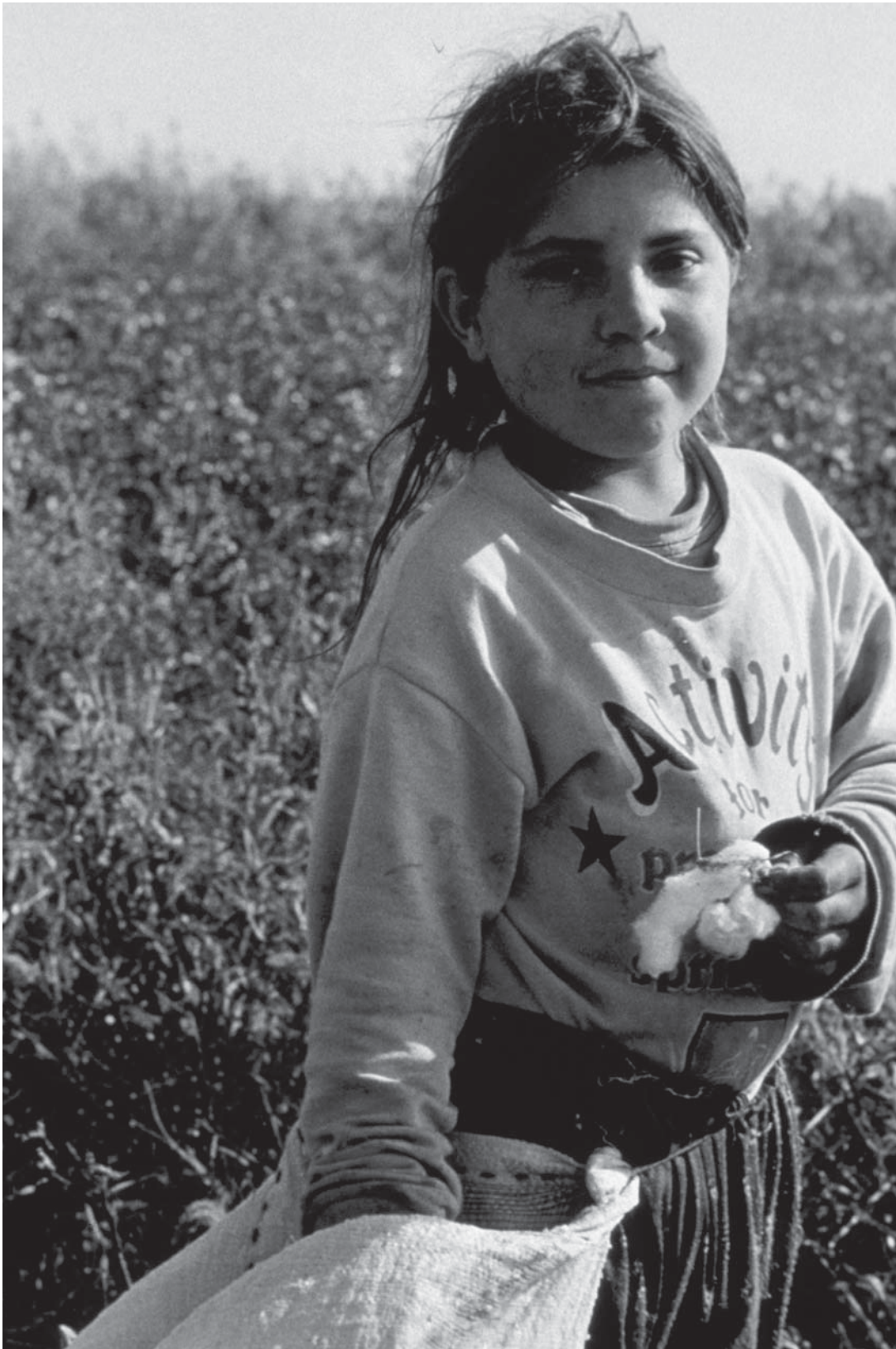
Niña migrante trabajando en un campo de algodón