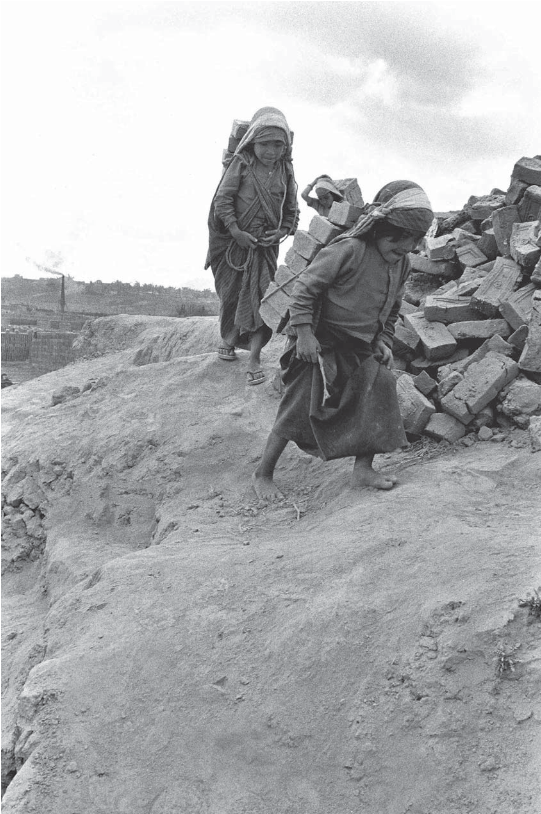
Niños cargando ladrillos en una fábrica de ladrillos