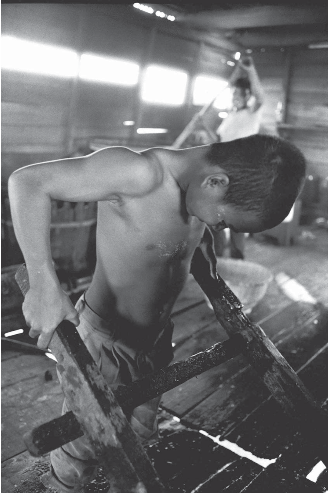
Niño trabajador en una plataforma de pesca