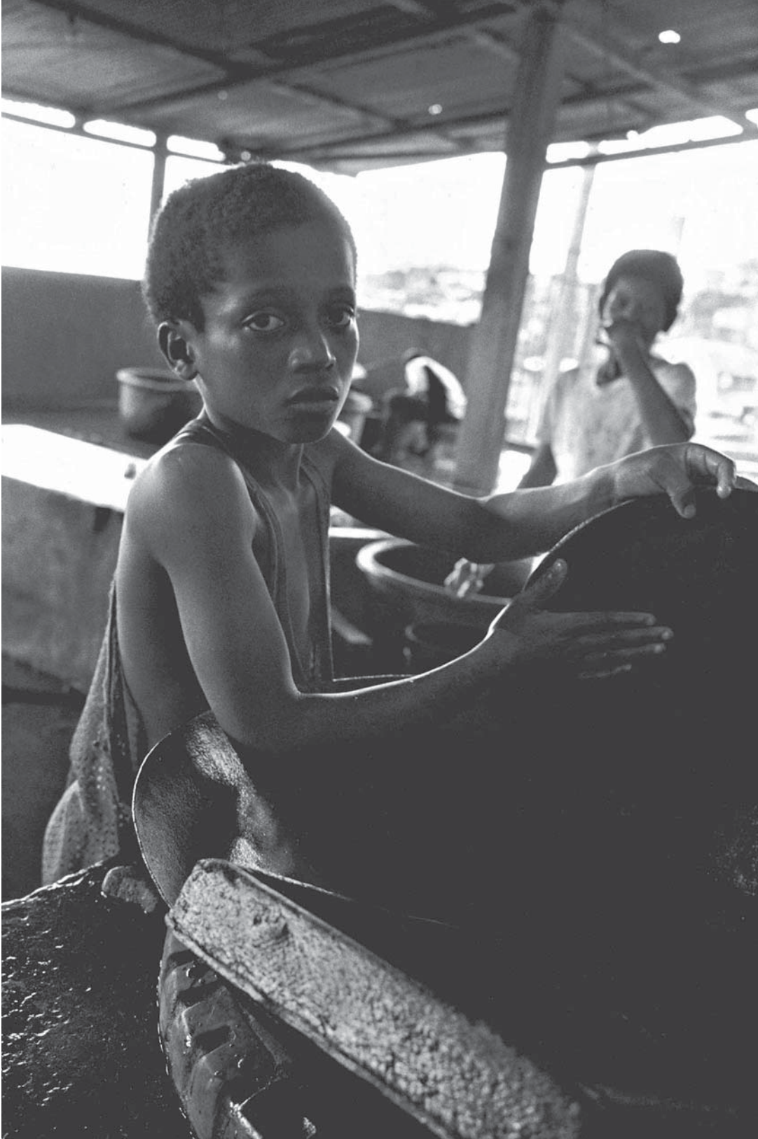
Niño amalgamando oro