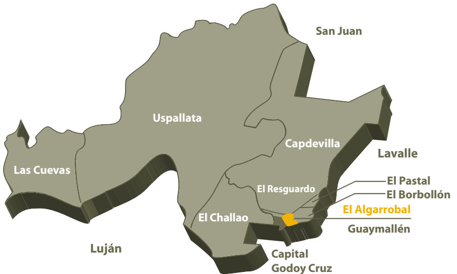
Mapa 1 - Departamento de Las Heras

El distrito de El Algarrobal se encuentra ubicado en el Sureste del departamento de Las Heras, a 10 km de la Ciudad de Mendoza, tal como se observa en el Mapa 1. Tiene una población aproximada de 13.841 habitantes (DEIE, 2010; ver Anexo), lo que representa el 6,59% del total departamental.