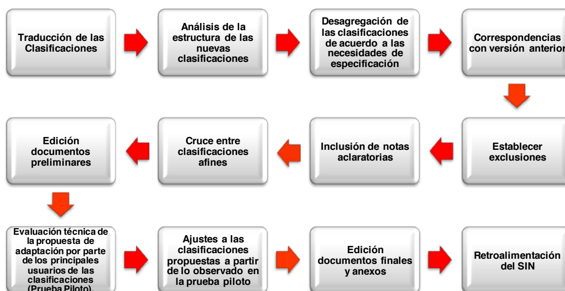
CUADRO No. 1

La nueva Clasificación fue puesta a prueba en algunas de las investigaciones que desarrolla el INEC como son: la actualización Cartográfica para el Censo Económico 2010 (550.000 establecimientos económicos); y la Encuesta de Empleo, Desempleo y Subempleo (Vigésima octava ronda de junio 2010); en base a los resultados obtenidos, se realizaron los ajustes técnicos correspondientes, para disponer finalmente de una Clasificación definitiva, idónea y consensuada, que garantice su aplicabilidad en las diferentes investigaciones estadísticas, (Ver cuadro 1):